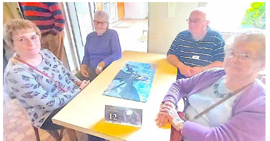
29 équipes sont venues jouer au concours de manille.

Une fois par an, il organise un voyage d'une journée avec comme impératif de ne pas avoir beaucoup à marcher et le car est rempli avec d'autres membres des clubs des environs. Le club compte actuellement 66 adhérents et accepte encore les inscriptions pour les personnes qui ont le loisir et l'envie de passer un bon moment de convivialité. Lors de la foire d'automne le 13 octobre, le club des aînés tiendra une buvette avec des crêpes et une tombola dans leur local, puis, le 7 décembre, il organisera un repas de Noël.